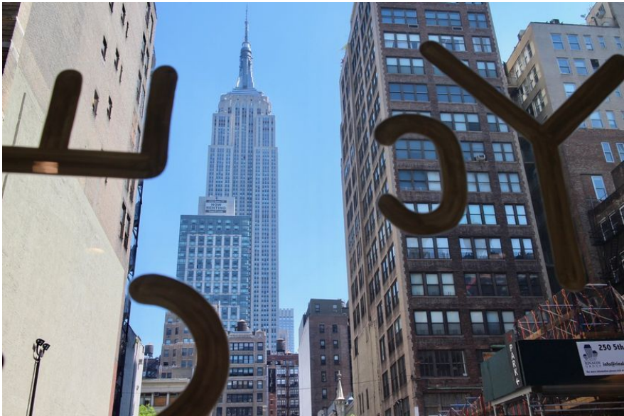
窓からはエンパイアステートビルを臨める。