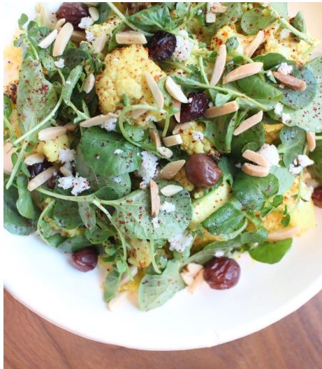
カリフラワーにほのかな酸味とフルーツの甘みが合わさった「Curry Cauliflower」（11ドル）。カレー味といっても新鮮な素材を味が引き出するような上品な味付け。