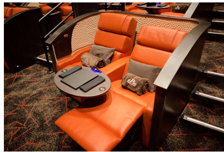
プレミアムプラスのシート。"フル"リクライニングで、枕やブランケットがついてくるのは「プラスシート」だけ！

アイピックのもう1つの特徴として、映画館にいることを忘れさせてくれるようなフード&ドリンク類の充実さだ。映画をゆっくり観ながら、専属シェフ、シェリー・ヤードさんによる創作料理「ダイニング・イン・ザ・ダークメニュー（暗闇の中のダイニングメニュー）」を楽しめる。