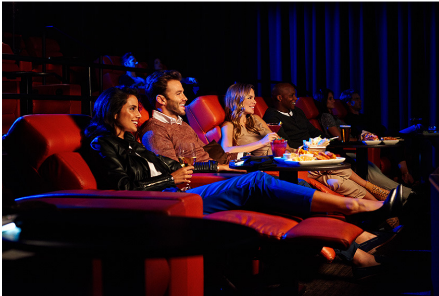
3Dなど最新のテクノロジーを完備したシアター（デブロイ7.1チャンネル・ドルビーサウンド4Kデジタル）。