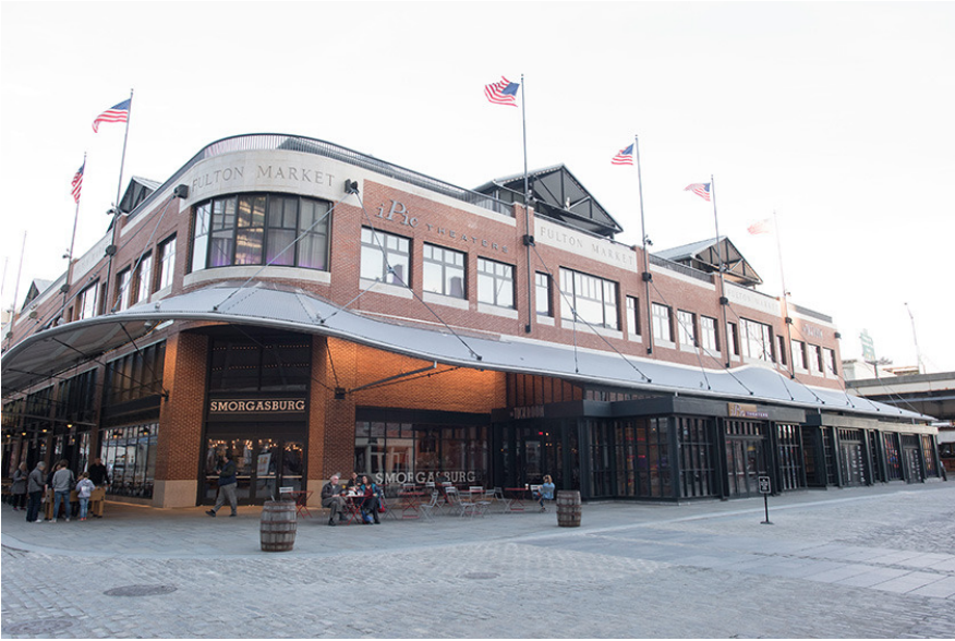
10月にオープンしたアイピックが入居する、フルトンマーケット・ビル。アイピックは2006年にフロリダで創業。現在は全米15都市に拡大中だ。

場所は、2012年のハリケーン・サンディーで浸水被害のため壊滅状態にあったマンハッタン最南端のシーポート・ディストリクト。人気があった観光地&商業施設「サウスストリート・シーポートのピア17」なども浸水被害のため惜しまれながら取り壊されもしたが、近年この跡地周辺は新しく変貌を遂げている。人気の屋台市場「スモーガスバーク」のような話題の店や施設が続々とオープンしており、現在工事が進められている2アベニューの地下鉄駅も近い将来、完成する予定だ。