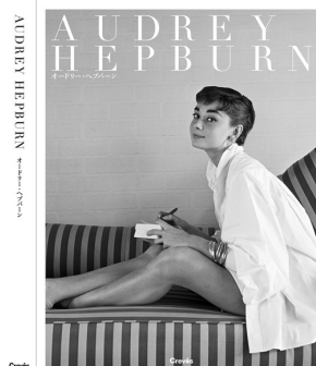
『Audrey Hepburn オードリー・ヘプバーン』