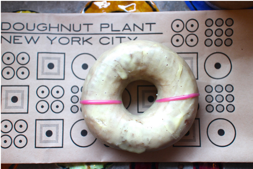
Doughnut PlantのPassion Fruit Donut（1個3ドル50セント）。甘酸っぱいパッションフルーツ味が特徴。

ニューオープンの店や市内の中心部にある店ばかりではないが、どの店も新商品を出したりコーヒーにこだわったりと、手を変え品を変え自社商品をアピール。例えば日本にも支店を持つ「Doughnut Plant」は、今年に入って抹茶やゆずなど日本のフレーバーを使ったシーズンメニューを期間限定発売し話題となった。