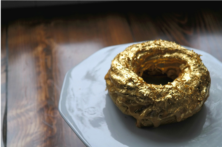
Manila Social Clubで販売されている話題のGolden Crystal Ube Donut（1個100ドル、1ダース1000ドル）。毎週金曜日に店でのピックアップ販売のみ。

金のドーナツを発売したのは、ブルックリンの「マニラ・ソーシャルクラブ」というフィリピン料理の影響を受けたファインダイニング・レストラン。同店は、ディナーやランチのみならずドーナツにもかなり力を入れている。