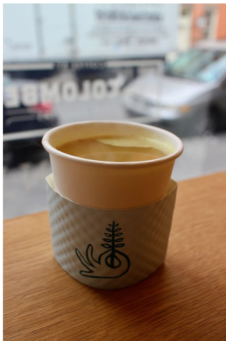
2016年5月、マンハッタンのダウントウン（グリニッチビルッジ）にオープンした「Springbone Kitchen」のボーンブロス。牛、鶏、野菜の各種ブロス（全9種）がそろう。