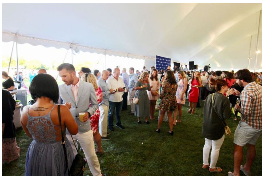
「Chefs &amp; Champagne」

Chefs & Champagneの説明からしよう。主催は「James Beard Foundation」（ジェームズ・ビ Beard 財団、以下JBF）。数々の功績を残した料理人ジェームズ・ビ Beard の名を冠した由緒ある団体で、そこからの受賞は、料理界のアカデミー賞とも言われるほど権威があり、レストラン業界で知らない人はいない。