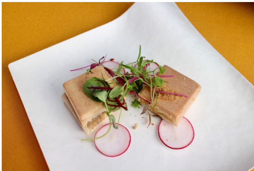
五穀屋のよつわりもなかの皮を使ったアミューズ2品。

五穀屋がこのパーティーで用意したのは、同社の商品である「よつわり」という、もなかの皮を使ったアミューズ2品「焼きトウモロコシとローズマリー、醤油のフリーズドライ」「味噌ピーナッツと水窪のアワ、ミントの香り」。監修者として参加したジャンジョルジュ東京の米澤文雄シェフが創作した限定スイーツで、どちらも甘さ控えめでサクッと食べやすい。