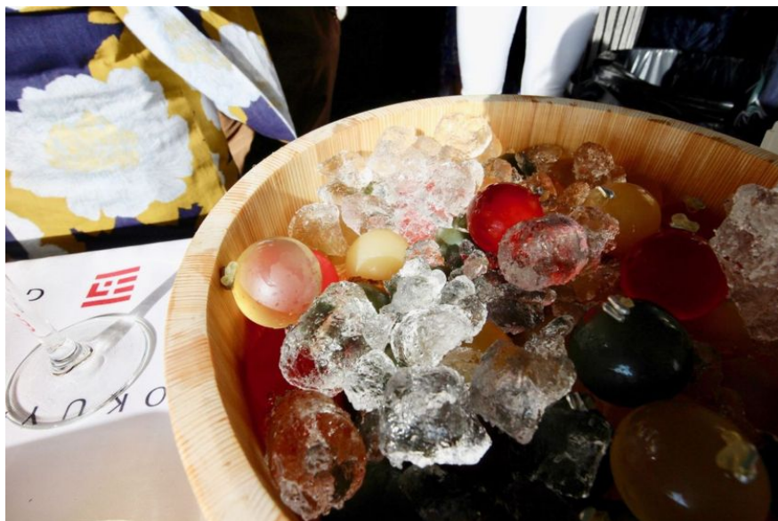
五穀屋からは、玉羊羹「五季」も提供された。

五穀屋のブースは、会場入り口近くと恵まれた場所だったのと、スタッフが涼しげな浴衣姿だったため、来場者の目に止まるのに時間はかからなかった。どの人も初めて目にする和菓子に、「これなに？」と覗き込むように興味を示す。スタッフが説明しながら差し出すもなかに戸惑いを見せる人はおらず、どの人もためらいなく「パクッ」。どの来場者からも、絶賛の声があがった。